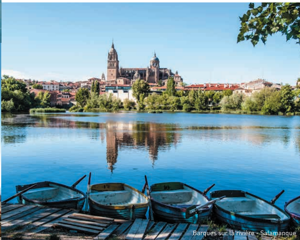
Barques sur la rivière - Salamanque