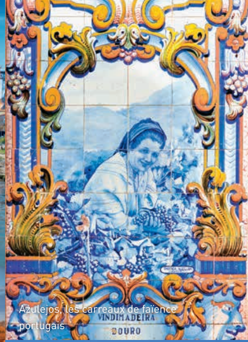
Azulejos, les carreaux de faïence portugais