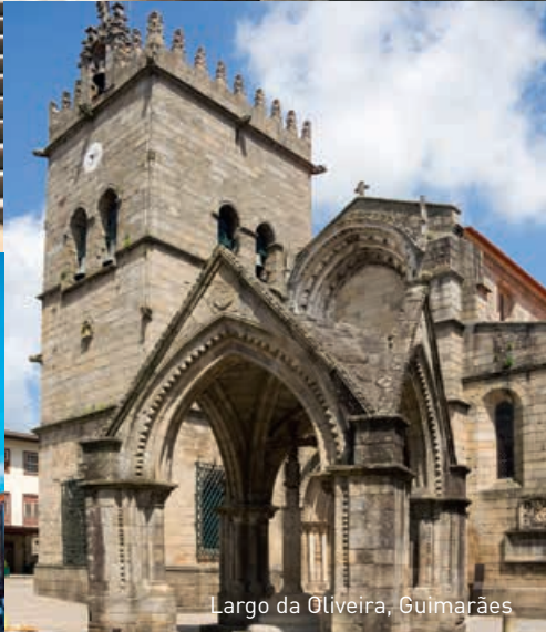
Largo da Oliveira, Guimarães