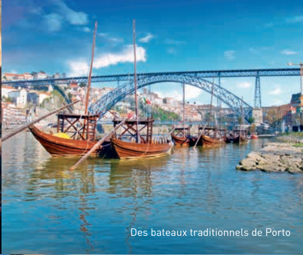
Des bateaux traditionnels de Porto