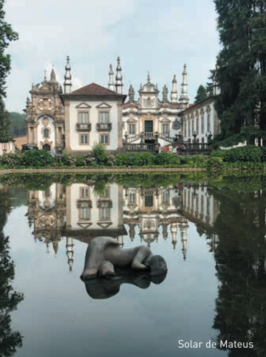
Solar de Mateus