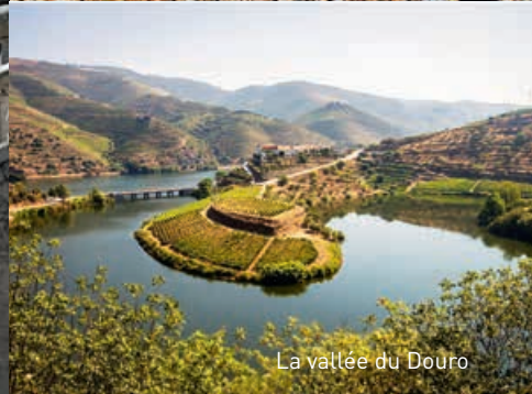
La vallée du Douro