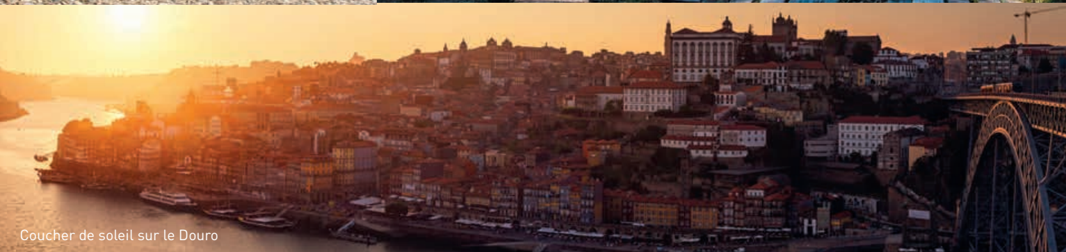
Coucher de soleil sur le Douro